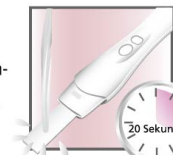
Mit der Testspitze nach unten zeigend in den Urinstrahl halten